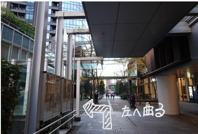
アーケードの屋根が切れるところを左に曲がります