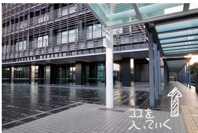
この道に入っていきます