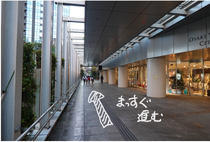
屋根がなくなるところまで真っ直ぐ進む