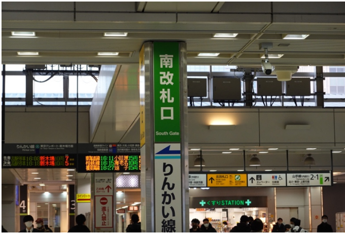
JR 大崎駅を降りて、南改札口へ行きます