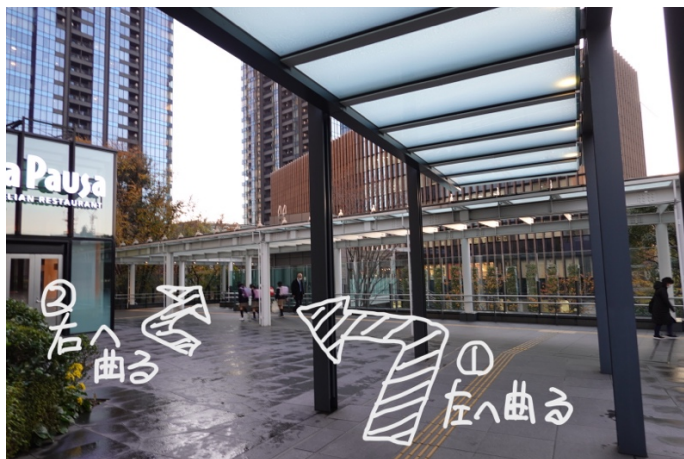
突き当たって左に曲がり、パスタ屋さんの前の道を右に曲がります