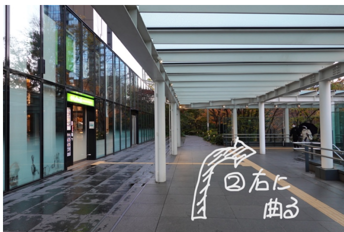
左の LAPAUSA (パスタ屋さん) 方向の左に曲がります