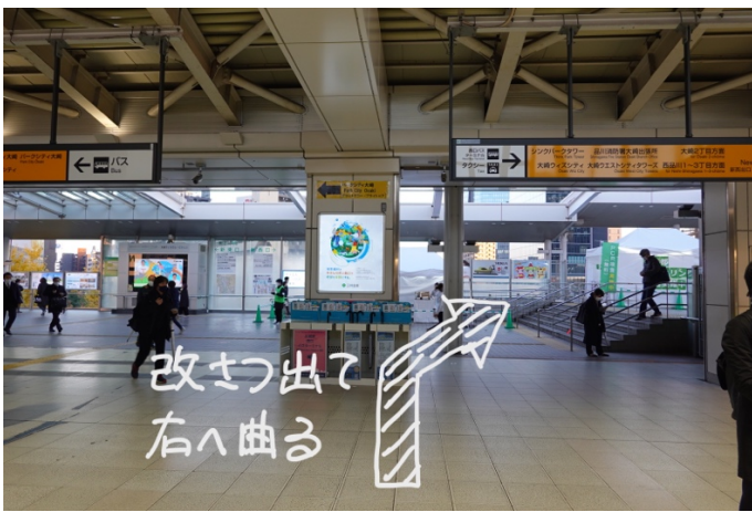
(南改札口を出たところ) 改札をでて右に曲がります