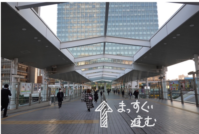
(右に曲がったところ) そのまま、突き当たりビルまでまっすぐに歩きます