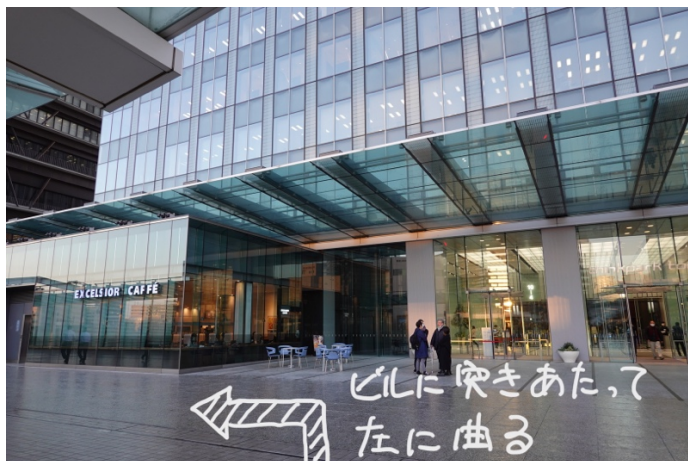
(ビルに突き当たったところ) ここを左に曲がります