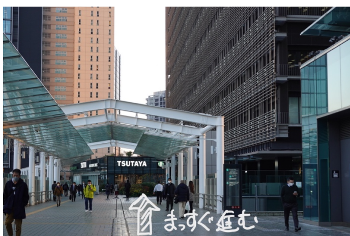
(左に曲がると正面に TSUTAYA の看板が見えます) TSUTAYA の看板に向かって進みむと右手に SONY ビルがあります その角を右に曲がります