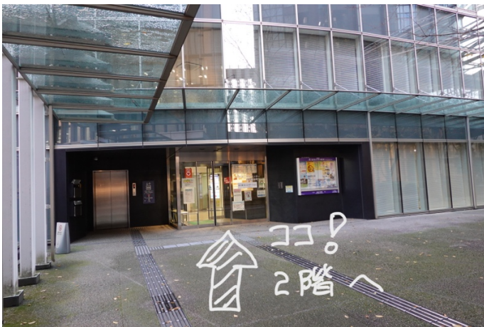
(左に曲がったところ)